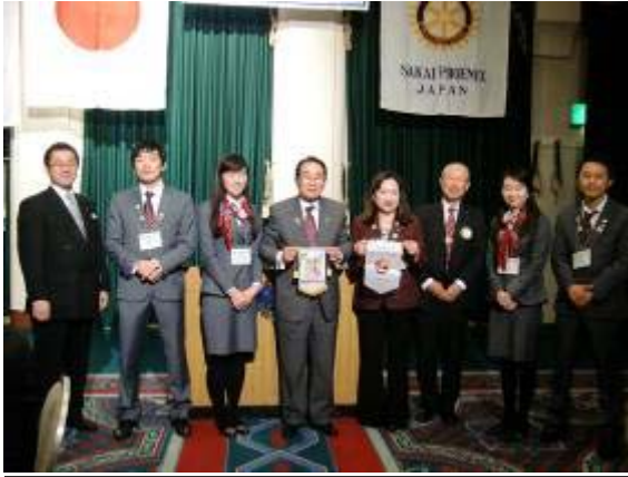
堺フェニックス例会出席