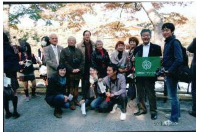
堺東南 RC のメンバーと