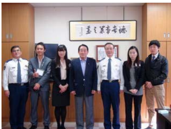
かつらぎ警察署での記念撮影