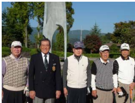
橋本カントリークラブで