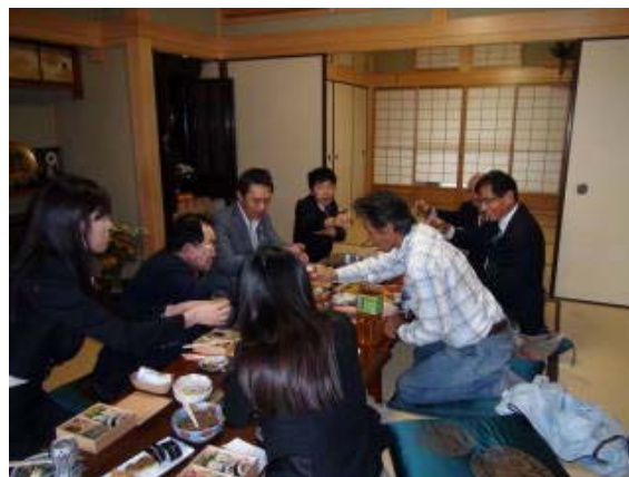
野畔の里での昼食会