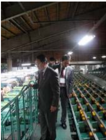
有田南 RC 例会出席