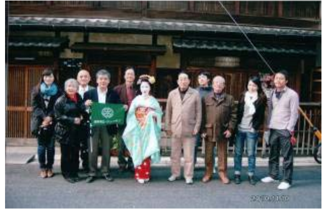
京都舞妓さんと記念撮影