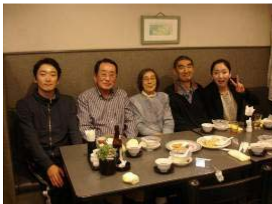
門協会長家族と夕食