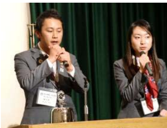
チョーテヒとイ イムナム