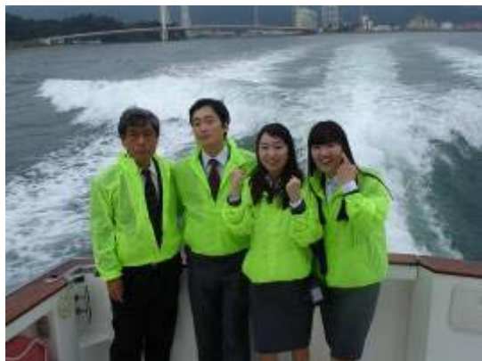
和歌浦湾クルージング