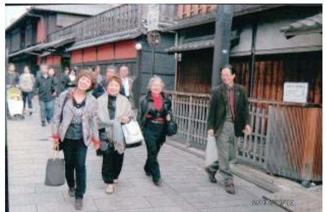
京都の古い町並み散歩