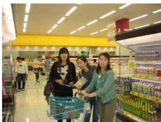
スーパーでのショッピング