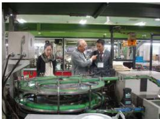
リハビリセンター福祉工場