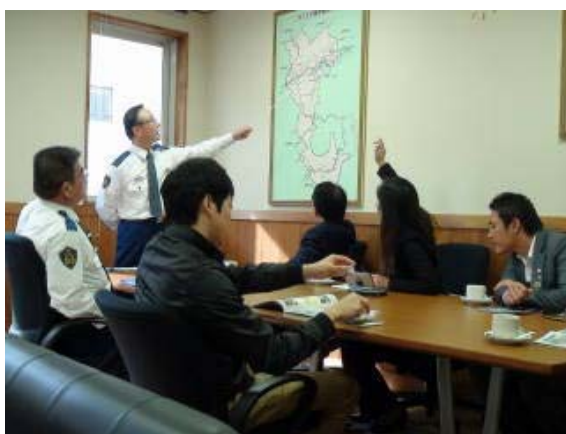
かつらぎ警察署での研修