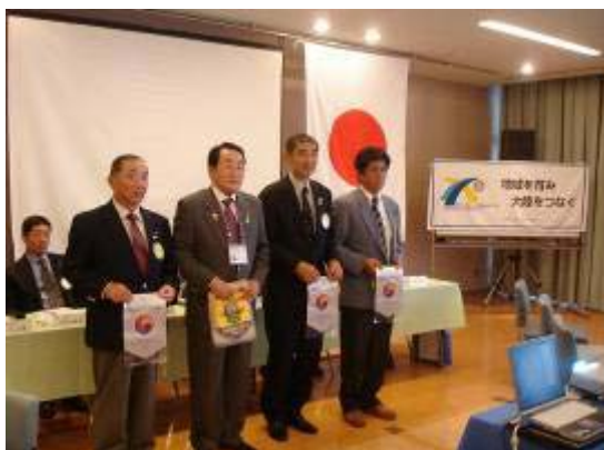
海南3クラブ合同例会