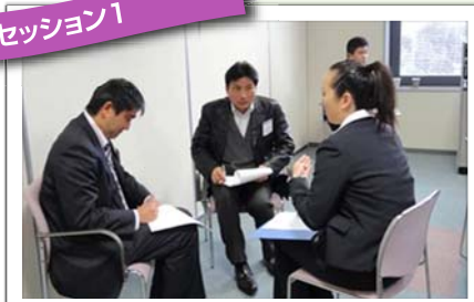
ロータリーに於けるリーダーシップ