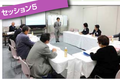
米山記念奨学事業(その1・基礎編)