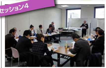
ロータリー財団(その1・基礎編)