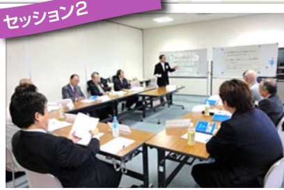
クラブレベルを越えたロータリー