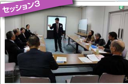
会員組織と会員維持(その1・基礎編)