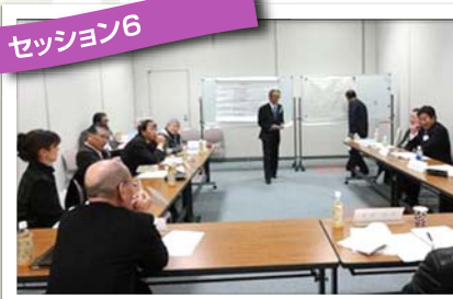
ロータリーの効果的な奉仕プロジェクト