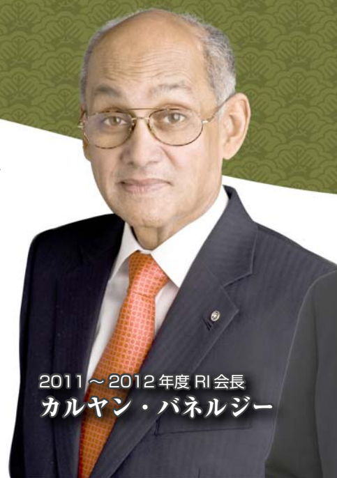
2011～2012年度RI会長 カルヤン・パネルジー