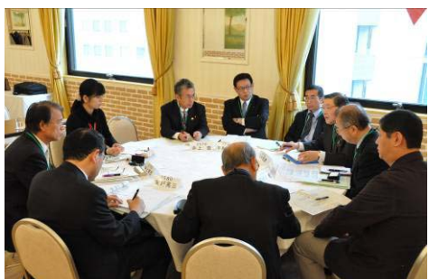
2日目グループディスカッション。各地区の問題点を出し合い、情報や解決策を共有する場に。