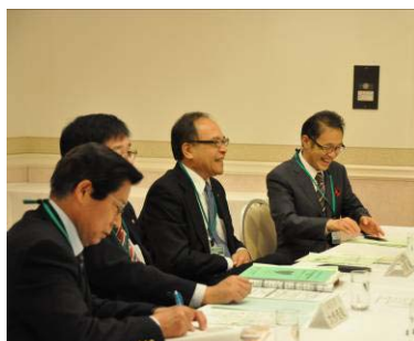
2日目グループディスカッション。各地区の問題点を出し合い、情報や解決策を共有する場に。