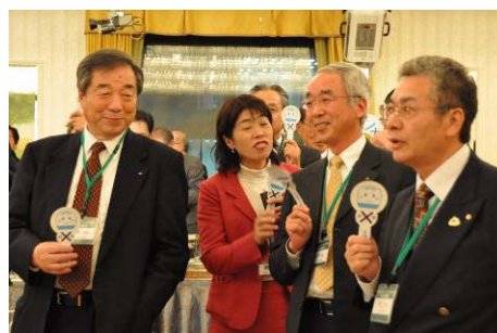
懇親会では〇×クイズで米山を勉強？